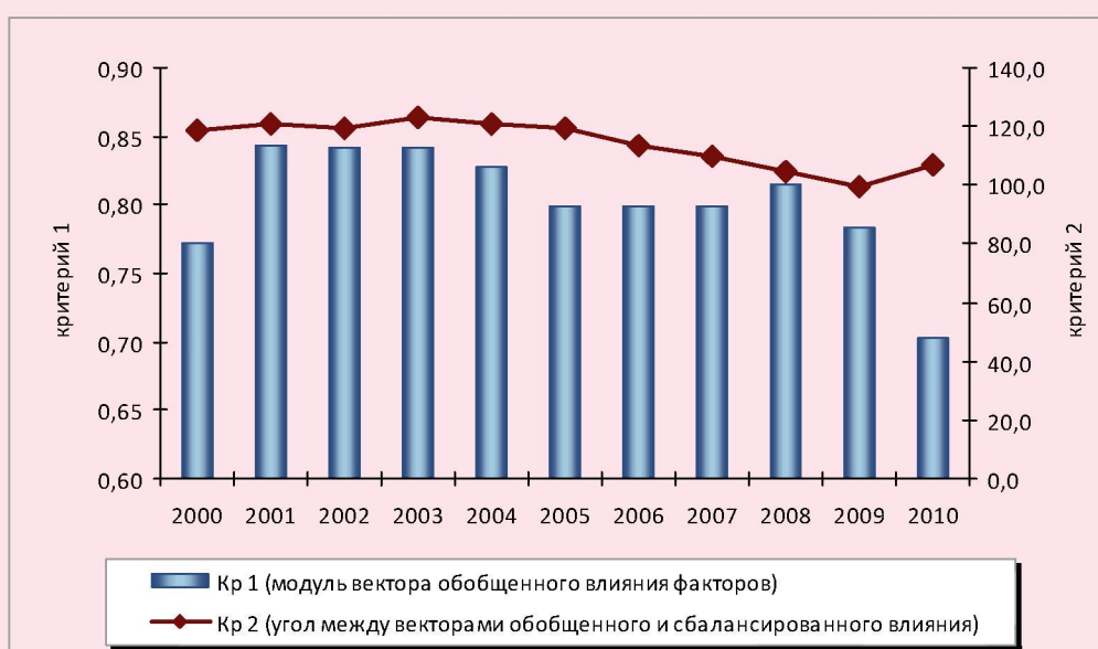
Рисунок 2. Динамика сбалансированности развития регионов Российской Федерации в 2000–2010 гг.

С учетом того, что величины b_j , j = \overline{1, n} характеризуют обобщенное влияние j -го фактора на систему в целом (то есть на все главные компоненты), для оценки степени